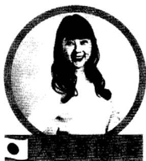
日本博報堂集團 100年生活者研究所