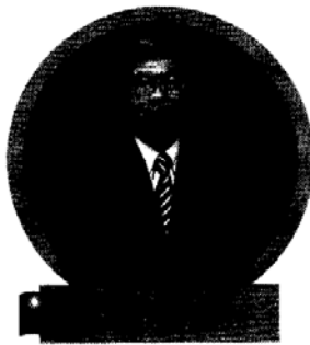
台灣銀髮產業協會 理事長