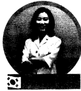
首爾50 Plus基金會 政策研究團隊負責人