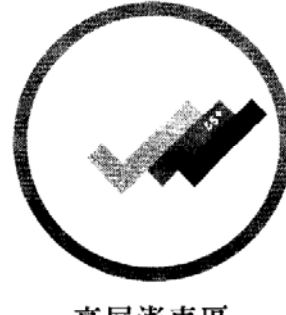
高屏澎東區 銀髮人才資源中心