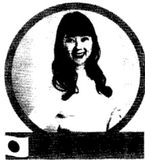
日本博報堂集團 100年生活者研究所