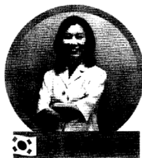
首爾50 Plus基金會 政策研究團隊負責人