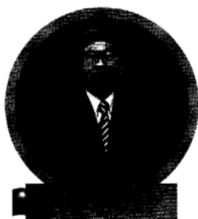
台灣銀髮產業協會 理事長